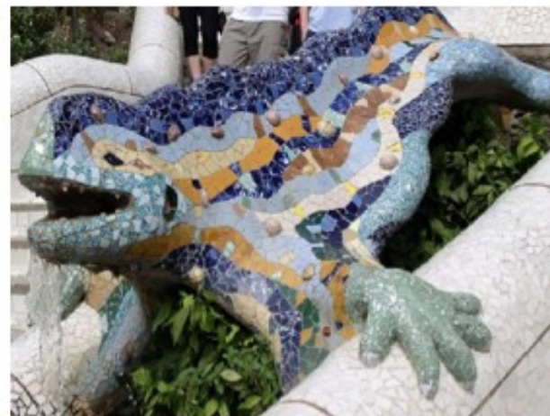
Parco Guell, Barcellona

Artista spagnolo, ANTONI GAUDÍ, crea forme architettoniche stravaganti, sfruttando le possibilità plastiche del CEMENTO che modella con grande libertà inventiva. Le forme sinuose e i volumi curvi sono arricchiti da motivi ornamentali, colori e mosaici.