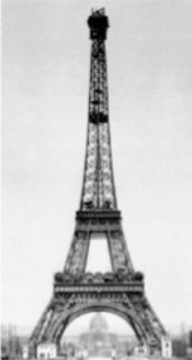
La TORRE EIFFEL

È una torre in ferro eretta da Gustave Eiffel nel 1889. E' una costruzione temporanea per l'Esposizione Universale di Parigi e molti la trovano orribile e ne prevedono il crollo. In realtà non sarà più smontata e consacrerà il successo del ferro in architettura.